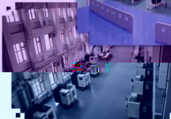
DMG 数控技术训练场所