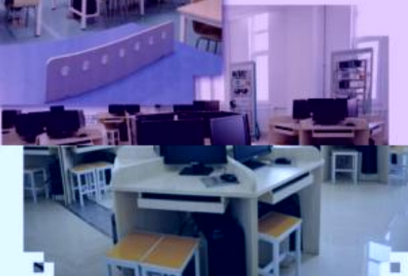
一体化课程教学设计综合实训室